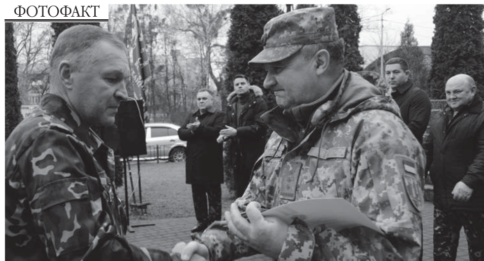
15 лютого у Вишгороді біля пам'ятника воїнам-інтернаціоналістам відбувся захід з нагоди Дня вшанування учасників бойових дій на території інших держав та 31-ї річниці виведення військ колишнього СРСР з Республіки Афганістан.