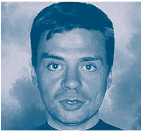
Наші земляки — у Небесній Сотні...