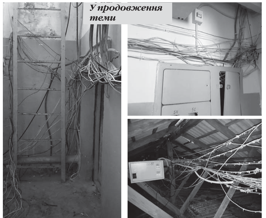
У продовження теми

Врешті-решт, усі провайдери пішли на контакт. Присутність їхніх представників дуже допомагає розібратися в усіх моментах. Тому сподіваємось, що раптових відключень мережі Інтернет по місту більше не буде. В іншому випадку мешканці Вишгорода будуть оповіщені заздалегідь.