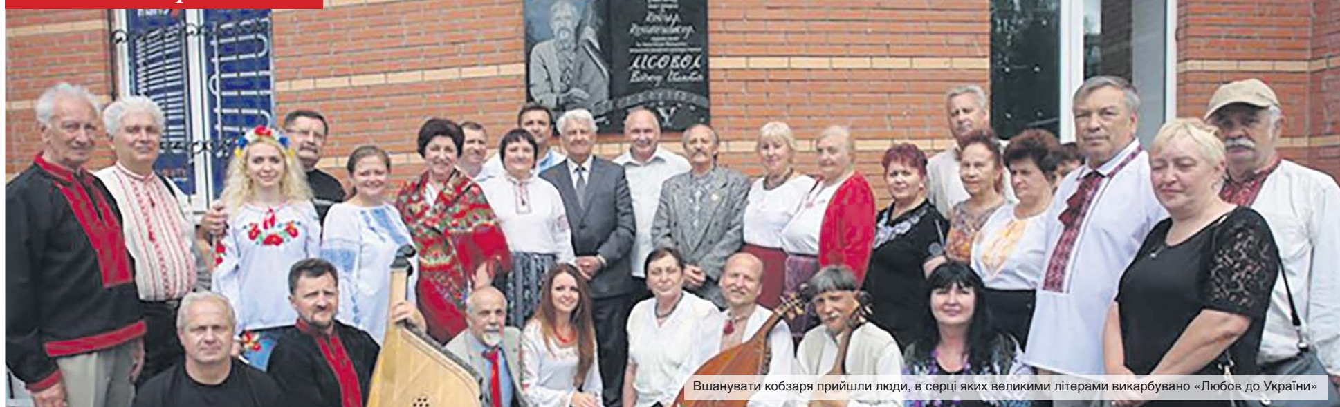
Вшанувати кобзаря прийшли люди, в серці яких великими літерами викарбувано «Любов до України»