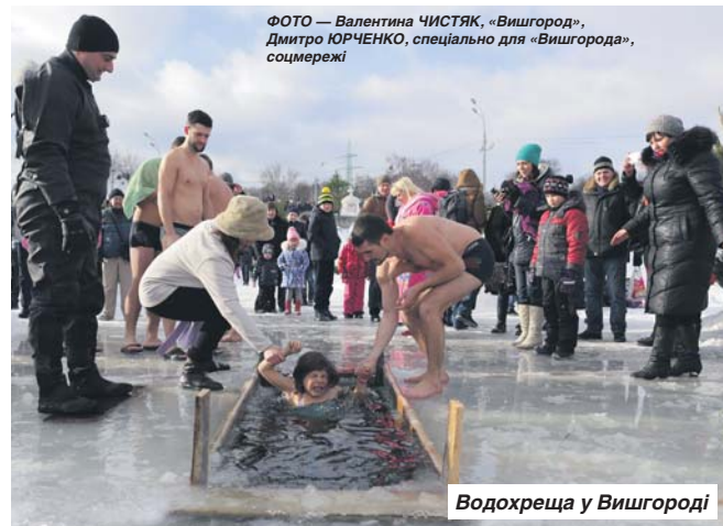
Водохреца у Вишгороді