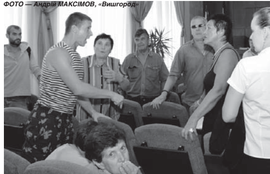
ФОТО — АНДРІЙ МАКСИМОВ, «Вишгород»

дину ранку 14 липня ц. р. (четвер). Розглядатимуть, зокрема: ставки земельного податку на 2017-ий рік та Положення про орендну плату за землю, нову редакцію Статуту КП ВМР «Вишегір» (після заслухання пояснень юристів апарату виконавчого міськради), зміни до детального плану території житлового кварталу з розміщенням громадських закладів на вул. Шкільній (орієнтовною площею 4 га), інвестиційний конкурс, зонінг площею 1300 га, Положення про тендерний комітет Вишгородської міської ради та його склад, а також іще кілька важливих для життєдіяльності міста питань, які не збирали на першому засіданні сесії необхідної кількості голосів.