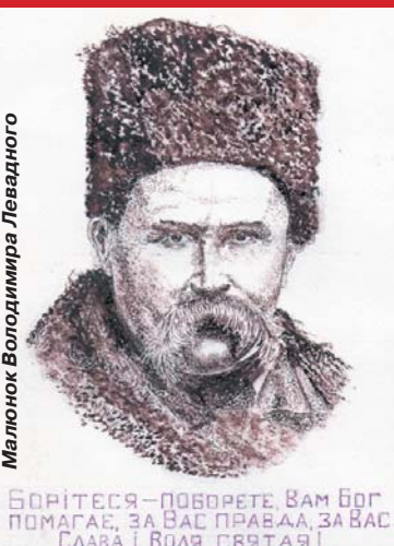
Малюнок Володимира Левадного

БОРІТЕСЯ – ПОВОРЕТЕ, ВАМ БОГ ПОМАГАЄ, ЗА ВАС ПРАВА, ЗА ВАС СЛАВА І ВОЛЯ СВЯТА!