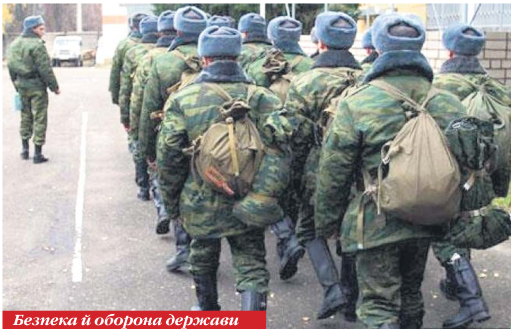
Безпека й оборона держави

У ході часткової мобілізації в армію мо-