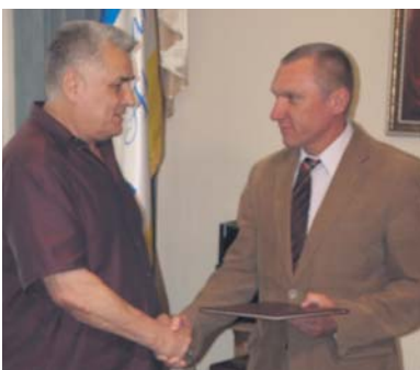
Президент Української академії наук О. Ф. Оніпко вручає диплом академіка В. М. Федосенку

Бажаю плідних успіхів у виробничій і науковій діяльності, творчого натхнення і злету, продуктивної участі у перспективному розвитку нашого рідного Вишгорода, у зміцненні місцевого самоврядування, зростанні активності та ініціативи місцевої громади, у вирішенні доленосних питань покращення добробуту вишгородців.