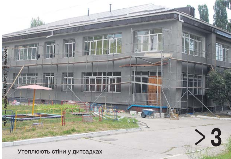
Утеплюють стіни у дитсадках