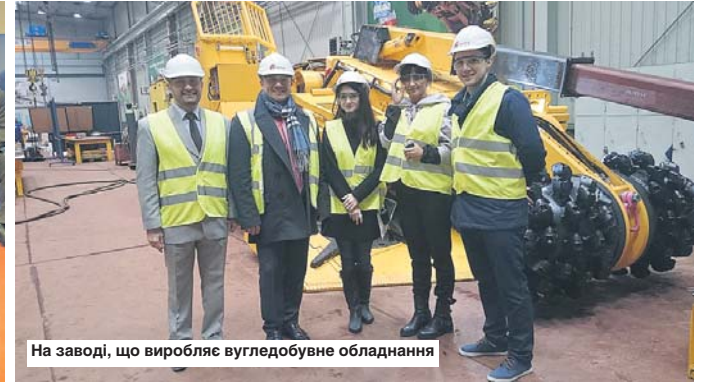
На заводі, що виробляє вугледобувне обладнання