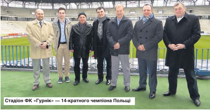
Стадіон ФК «Гурнік» — 14-кратного чемпіона Польщі