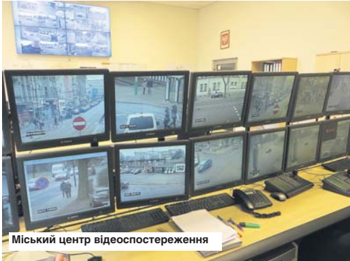
Міський центр відеоспостереження