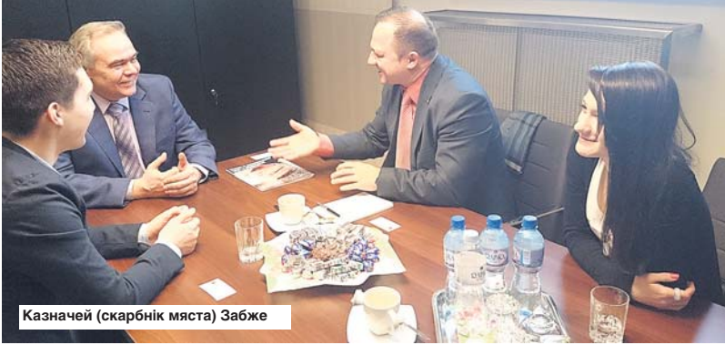
Казначей (скарбник м'яста) Забже