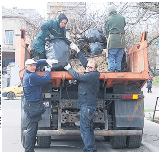
Працівники Вишгородської міської ради прибрали пустир по вул. Н. Шолуденка