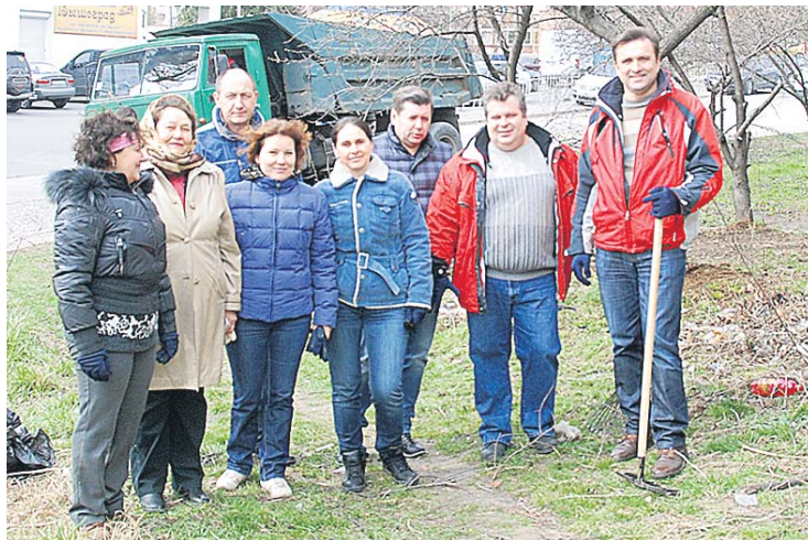
Асоціація роботодавців Вишгородщини привела до ладу схил по вул. Набережній