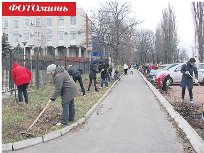
Працівники управління Пенсійного фонду України у Вишгородському районі також долучились до благоустрою