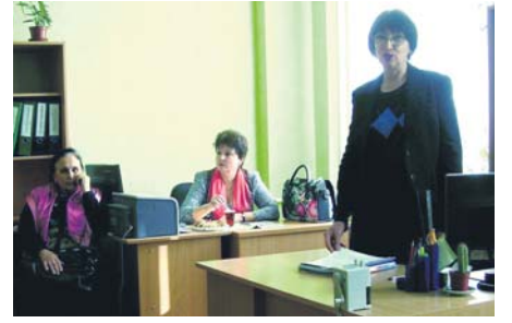
Під час засідання круглого столу