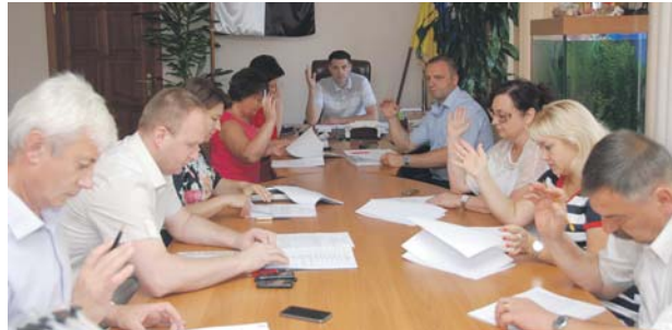
Влас. інф.

17 липня відбулося чергове засідання виконавчого комітету Вишгородської міської ради. Головував заступник Вишгородського міського голови Олексій Данчин. Розглянули та затвердили 27 питань.