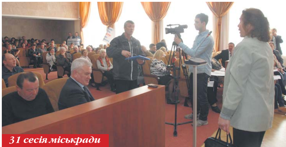
31 сесія міськради

Далі депутати підтримали чи відхилили низку земельних питань громадян (особиста чи спільна часткова власність) і ТОВ, поклавшись на рекомендації земельної комісії та звернувши особливу увагу на проекти, що стосувалися експертної грошової оцінки земельних ділянок, які перебували в оренді та підлягають продажу, а також на звернення невишгородців щодо надання землі для ведення особистого сільськогосподарства тощо на території Вишгорода.