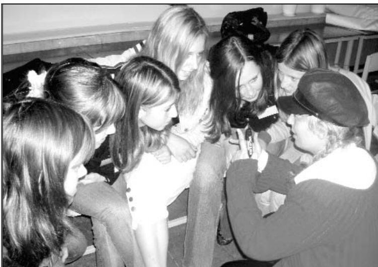
Тренінг з комунікації. Нові знайомства і активні, цікаві, веселі способи спілкування.

Урок 1. Вчимося комунікації Щоб здобути перші необхідні волонтеру навички — навички комунікації, ми презентували себе, віталися один з од-