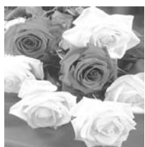
Друзі № 381

Зичимо життя любити, труднощі долати, Кохати і страждати, про щастя мріяти, І вірним друзям безоглядно вірити, І від життя іще багато взяти. Ще сонце високо, іще зелені клени, Ще небо синє, ранки ще прозорі. Хай не торкнуться Вас зими проблеми, Хай Вам у душу світять ясні зорі!