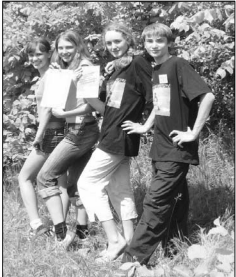
Із дев'яти нагород — три у вишгородських гуртківців Центру творчості "Дивосвіт"

Чотири дні зльоту Вишгородський район представляла команда краєзнавців гуртка "Історія рідного краю" Вишгородського районного центру художньої творчості дітей, юнацтва та молоді "Диво-