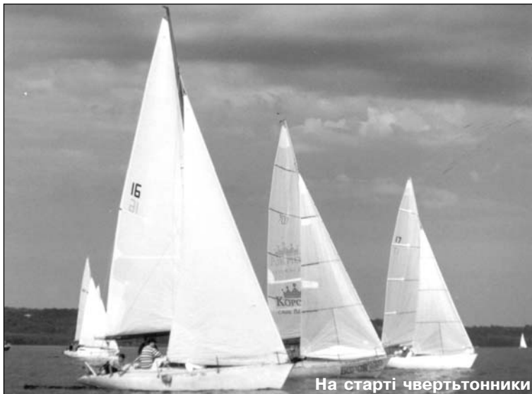
На старті чвертьтонники

Для відзначення цієї події флотилія "Вільні Вітрила" запропонувала провести меморіальну вітрильницьку регату "Жовті Води". Цю патріотичну ідею палко підтримав маршал козацтва Дмитро Сагайдак, взявши над регатою патронат. На водоймищі Київської ГЕС (база яхт-клубу "Водник") 51 учасник — з яхт-клубів "Водник", "Енергетик", ДЮСШ Облради ФСТ "Україна" та з флотилії "Вільні