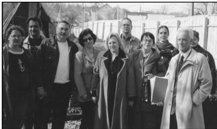
На території гончарного центру — Межигірського Спаса, 11-13

З Вишгородом пов'язані життя і творчість багатьох видатних людей України. Нашому місту належить важлива роль у розвитку української державності, освіти, культури. Вже 30 років, як Вишгород увійшов до списку особливо цінних історичних міст. Давньо-