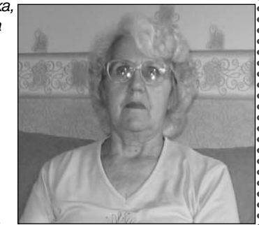
Люблячі діти та онуки

Наша матуся й бабуся дорогенька, будь завжди нам здоровенька і спокійна, і щаслива, літ до ста така ж вродлива. Щоб добре спала ти щоночі, щоб сні приходили дівочі, життю всміхалася й раділа та ще співати мала сили! Вітаємо тебе щиро, бажаємо спокою й миру, благополуччя та достатку, щоб в тебе все було в порядку.