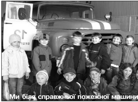
Ми біля справжньої пожежної машини

Наша перша прогулянка, ми її так чекали, і ось, нарешті, ми, разом із друзями-новаками, старшими дівчатами і виховницями йдемо на прогулянку, і не просто прогулянку до лісу, а разом з екскурсією в нашу пожежну частину!