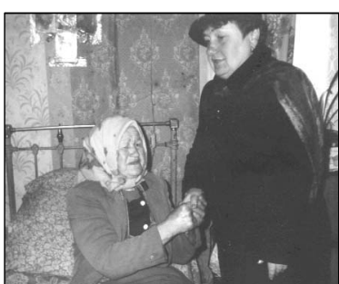
Продуктові та гігієнічні набори отримують від РОТЧХ переселенці із зони відчуження

Чорнобильська аварія призвела до значного забруднення екосистем майже всієї Європи. Радіоактивний матеріал, викинутий в атмосферу після аварії, був зафіксований практично в усій Північній півкулі, і більшість випала в районах, що прилягають до території ЧАЕС. Внаслідок Чорнобильської катастрофи в Україні повністю "звільнилася" від населення деякі великі, середні і малі міста та села. Всього до середини серпня 1988 року з 81 населеного пункту було евакуйовано 90 784 особи.