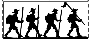
Закінчення на стор. 7

Біля визначених місць стояли інструктори, які мали завдання для команд. Кожне завдання було пов'язане з однією з 14 точок (пунктів) Пластового Закону, що відображають прикмети і є дороговказом пластуна: пластун словний (дотримується слова); сумлінний (кожне діло, за яке добровільно взявся, виконує по змозі якнайкраще); точний (дотримується визначених меж початку чи кінця якогось заняття або виконання дорученого завдання); ощадний (без потреби і користі не витрачає ні грошей, ані часу, ані енергії); справедливий ; увічливий ; братерський і доброзичливий ; зрівноважений (не діє ніколи під впливом хвилинних настроїв); корисний (займається тим, що приносить чесну і справжню користь собі самому та іншим, також цінить і шанує працю інших людей); служняний пластовій старшині; пильний (ніколи не пропускає нагоди навчитися чи довідатися чогось корисного для свого розвитку); дбає про своє здоров'я ; завжди доброї гадки .