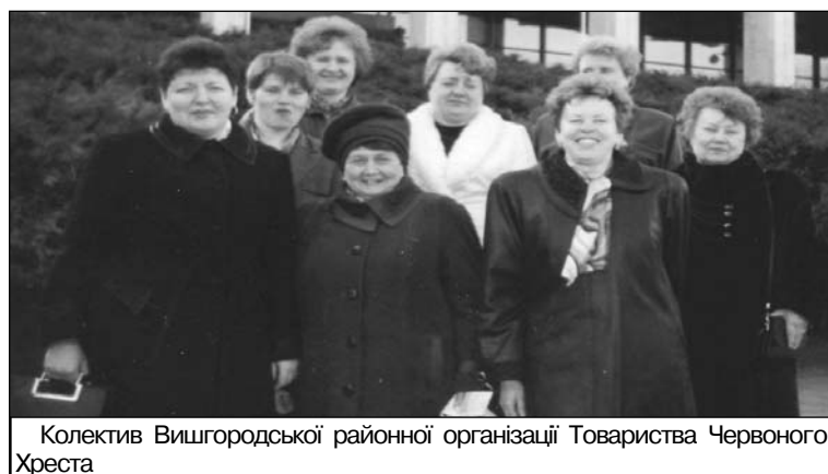
Колектив Вишгородської районної організації Товариства Червоного Хреста

Майже півтора століття тому починається відлік Червонохресного руху на Україні. Видатний хірург М. І. Пирогов під час Кримської війни (1853-1856 р. р.) вперше у світовій практиці привернув увагу громадськості: необхідно надавати