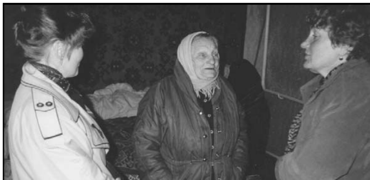
РОТЧХ привіз продуктові набори самотніми пристарілим переселенцям із зони відчуження с. Рудня Димерська