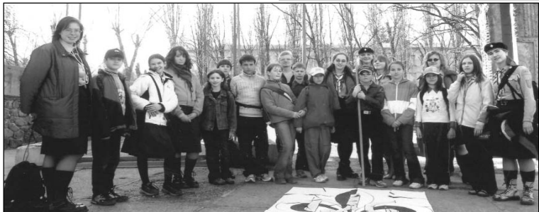
18 квітня - День Українського Червоного Хреста

Присягаюсь своєю честю, що робитиму все, що в моїй силі, щоб: — бути вірним Богові й Україні, — допомагати іншим, — жити за Пластовим Законом і слухатися Пластового Проводу.